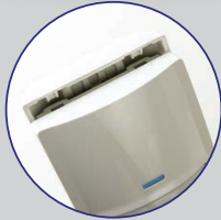
Slide to Fit Front Cover